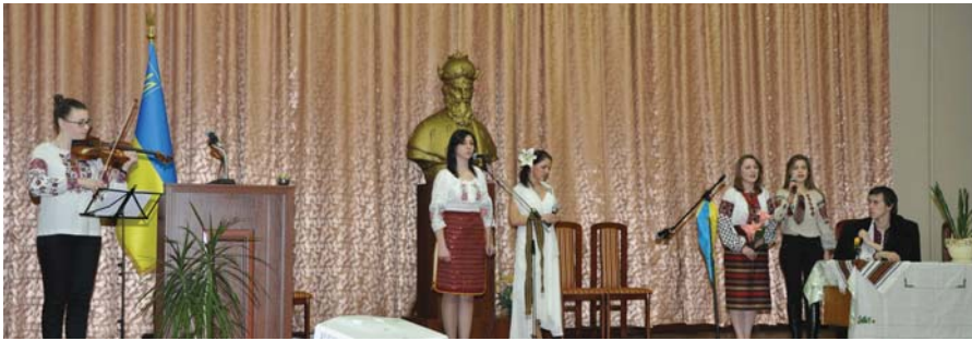
Хвилюючі моменти Шевченківського свята.

Повний фоторепортаж з цієї події можна оглянути у фотогалереї на сайті ЛНМУ імені Данила Галицького: www.meduniv.lviv.ua .