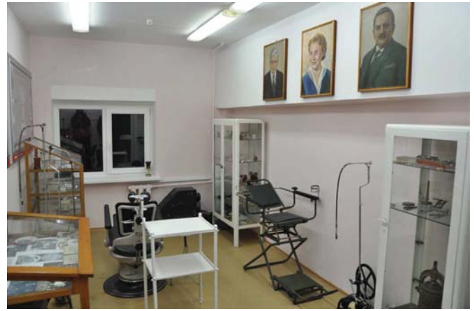
Музеї хвороб людини (ліворуч) та стоматології (праворуч)