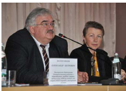
Професор О.П. Волосовець та професор І.Є. Булах у президії конференції

З ґрунтовною доповіддю, присвяченою актуальним аспектам підготовки та підвищення кваліфікації медичних і фармацевтичних кадрів у вищих навчальних закладах IV рівня акредитації та закладах післядипломної освіти МОЗ України, виступив заступник директора Департаменту роботи з персоналом, освіти і науки, начальник відділу освіти та науки МОЗ України, член-кореспондент НАМН України, професор О.П. Волосовець . Він повідомив про те, що Міністерство охорони здоров'я активно працює над системними змінами галузі, новою концепцією побудови системи охорони здоров'я України, де пріоритетними буде первинна ланка, профілактика, нова система управління з децентра-