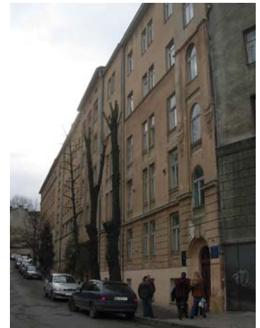
"Шпиталь імені митрополита Андрея Шептицького"

сестри-монахині, які були прийняті на роботу згідно чинного законодавства на посади медичних сестер. І сьогодні у шпиталі серед лікарів та середнього медичного персоналу є немало сестер-монахинь.