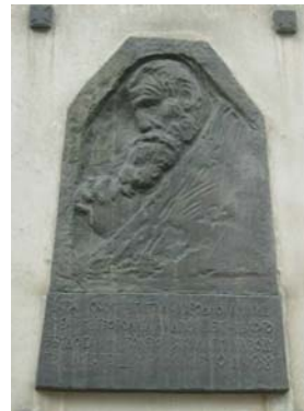
Колишня "Народна лічниця" – сьогодні Благодійна установа

Крім того, важко хворим людям вдома надається і духовна опіка, яку ми вважаємо невід'ємною складовою опіки медичної. Ще за часів митрополита Андрея Шептицького у 1934-1938 рр. для роботи в шпиталі були запрошені сестри чину Святого Вікентія з Бельгії. Впродовж тривалого часу вони отримували фінансову допомогу з-за кордону, що давало їм можливість працювати безоплатно. Після війни у шпиталі, який став державною лікарнею, продовжували працювати